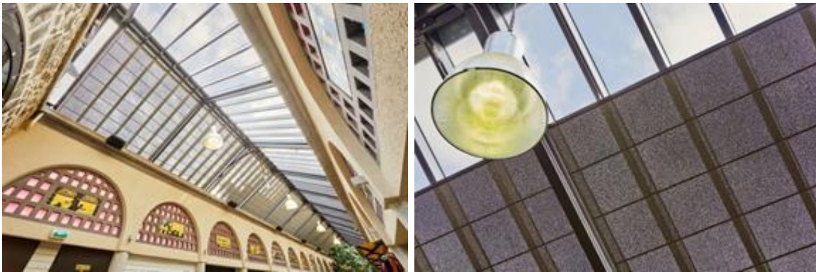
Halles de Dinan

Avec un taux de réflexion solaire pouvant atteindre 85 %, le store vélum SOLARIA complète le dispositif sur les zones spécifiques comme les verrières, et permet de moduler la lumière selon les usages.